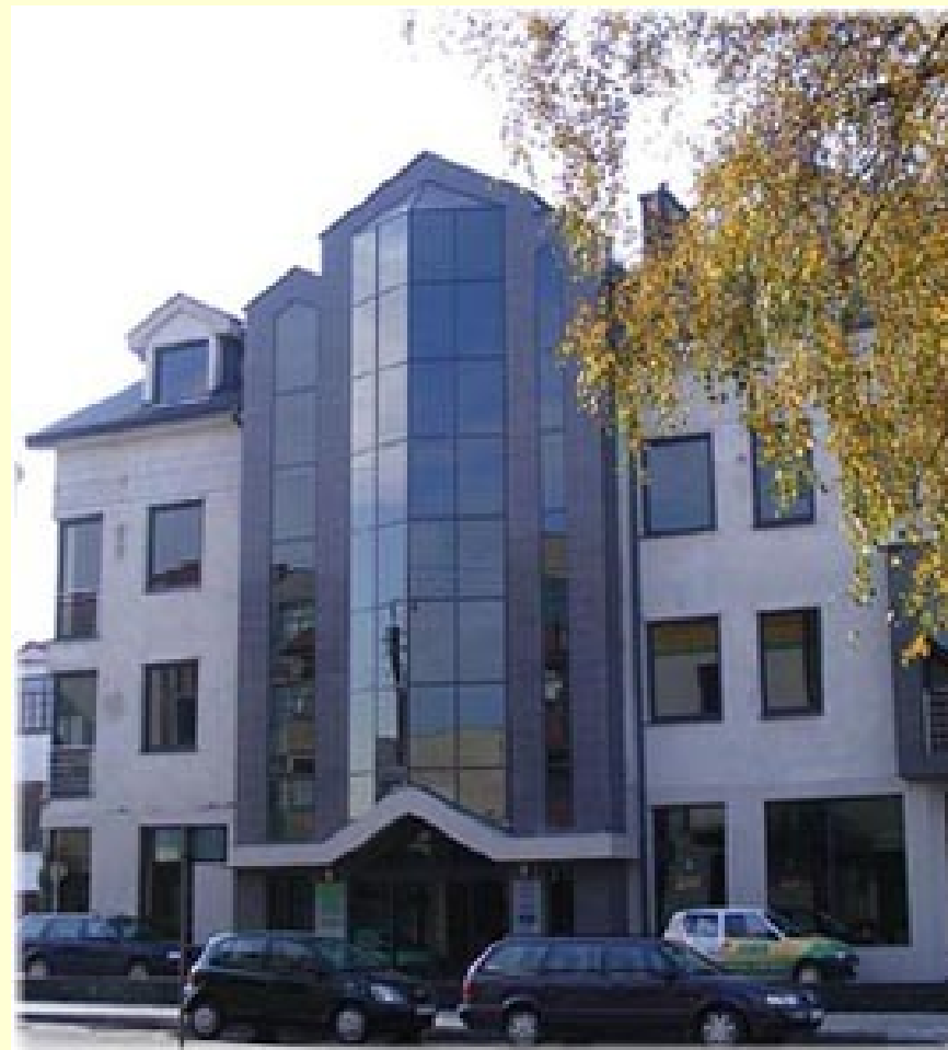
Siedziba DG-INWEST Biała Podlaska

Aleja Niepodległości 827-829 81-810 Sopot tel: 58/ 719 08 58 sopot@dginwest.com.pl